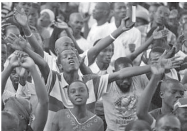
Вярата остава единствената утеха на хаитяните. Десетки хиляди потърсиха потърсиха близост един с друг и с Бога в първите дни след труса.

Земетресението в Хаити бе с катастрофални размери. Силата на труса беше 7-ма степен по скалата на Рихтер. Епицентърът му се намираше на около 25 км западно от столицата на карибската държава - Порт о Пренс. Земетресението се случи точно в 16,53 ч. местно време, във вторник, 12 януари, а дълбочината на епицентъра му бе около 13 километра. До 24 януари Американската геоложка служба регистрира поне 52 вторични труса със сила от 4,5 по Рихтер или по-голяма. Според изчисления на Международния Червен кръст около 3 млн. души са били засегнати от труса, което значи 1 на всеки трима от населението на карибската държава. Президентът на Хаити Рене Превал заяви на 28 януари, че „почти 170 хиляди“ тела са открити до този момент. Вестник New York Times обявя на 28 януари, че 20 хил. сгради с търговско предназначение и над 225 хил. домове са били унищожени. Според хуманитарните организации в края на януари жертвите са достигнали 300 хил. души. Броят на жертвите, обаче може да продължи да расте поради липсата на течаща вода и опасността от разпространение на зарази и болести. С 80 процента от населението й, живеещо под абсолютния праг на бедността, Хаити е най-бедната страна в Западното полукълбо. В момента на разрушителното земетресение тя все още се възстановяваше от урагана, опустошил острова през октомври 2008 г. и оставил десетки хиляди бездомни след себе си.