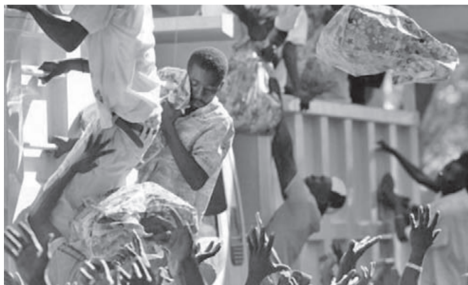
Хуманитарната помощ, доставяна основно от САЩ, остава единственият начин за одобяване с храна.