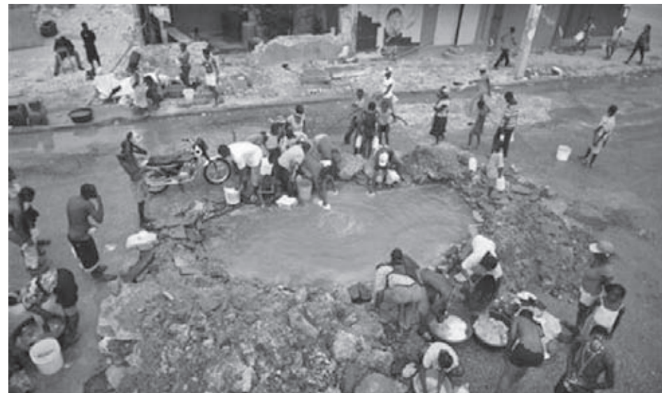
Жители на Порто о Пренс пълнят съдове с вода от стукан тръбопровод. Чистата питейна вода се превръща в първостепенен проблем пред оцелелите от земетресението.