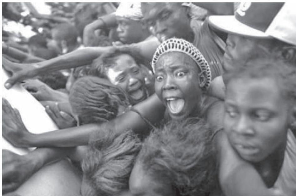
Жена крещи, в опита си до достигне храна раздавана пред президентския дворец в столицата Порт о Пренс, на 28 януари.

Повече от 55 църкви са напълно унищожени, а 60 други частично. Над 27 хиляди адвентисти са останали без подслон в столицата Порт о Пренс. Помощта, която църквата е оказала чрез благотворителната организация АДРА до този момент, надхвърля 1 млн. долара. Чрез усилията й оцелелите получават вещи от първа необходимост, както и таблетки и комплекти за пречистване на вода. В най-скоро време ще бъдат доставени водно пречиствателни станции и тестери за качеството на водата. Подобни методи ще осигурят чиста питейна вода за около 90 хил. души на ден. Президентът на църквата Ян Полсън направи специално обръщение както към адвентистите на острова, така и към цялото му население с една вест „Не губете кураж“. ХМ